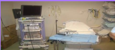
SALA DE HISTEROSCOPIA