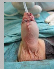
TECNICA DE MATHIEU