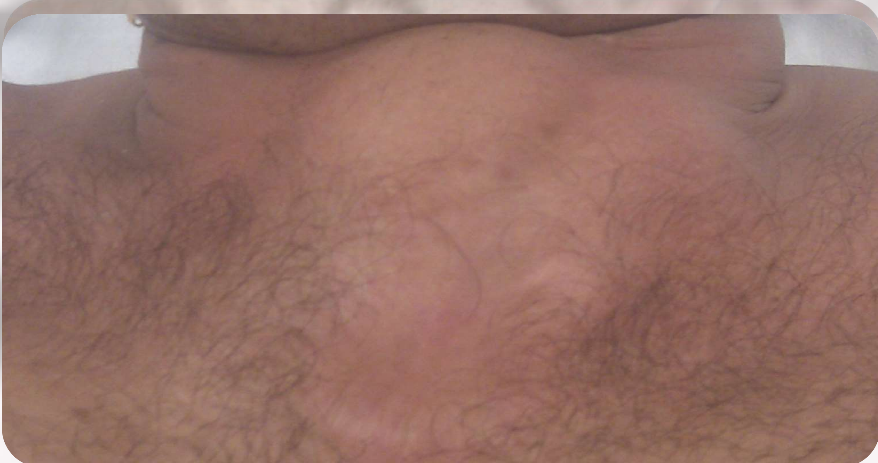
VISTA ANTERIOR DE LA OBSTRUCCIÓN