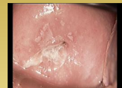
Después del tratamiento