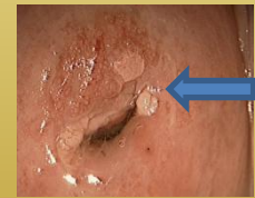
Durante el tratamiento