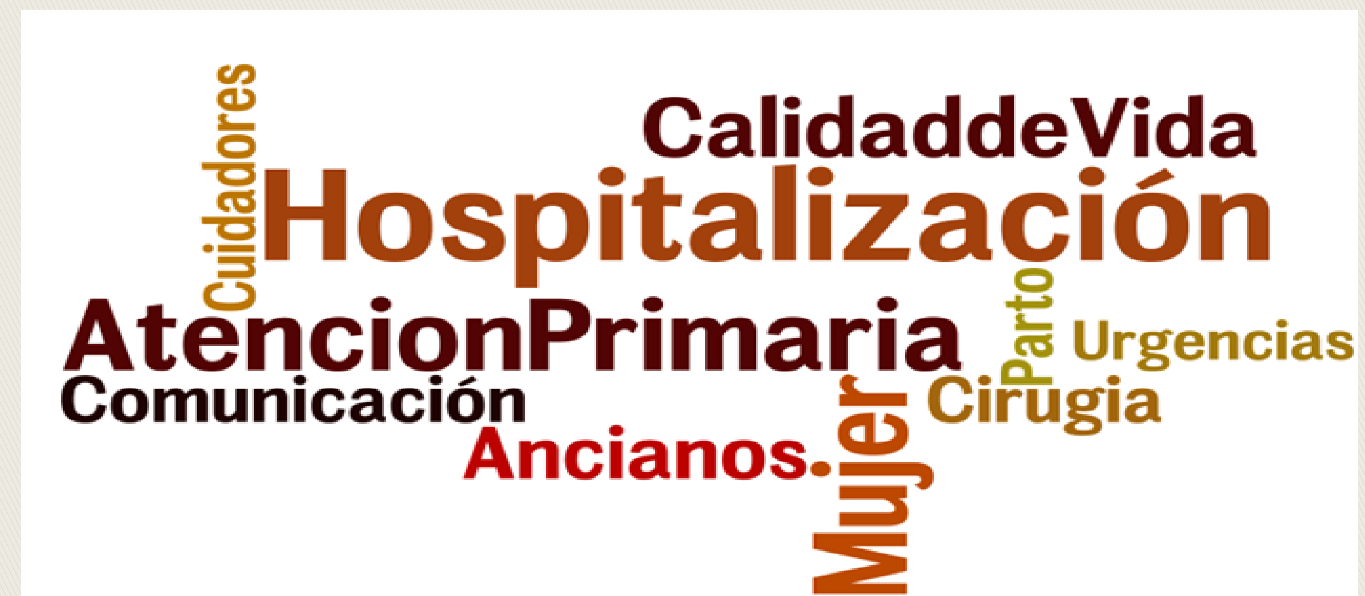
Figura 1. Nube de palabras