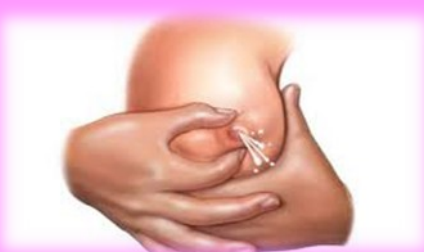
Gotitas de calostro