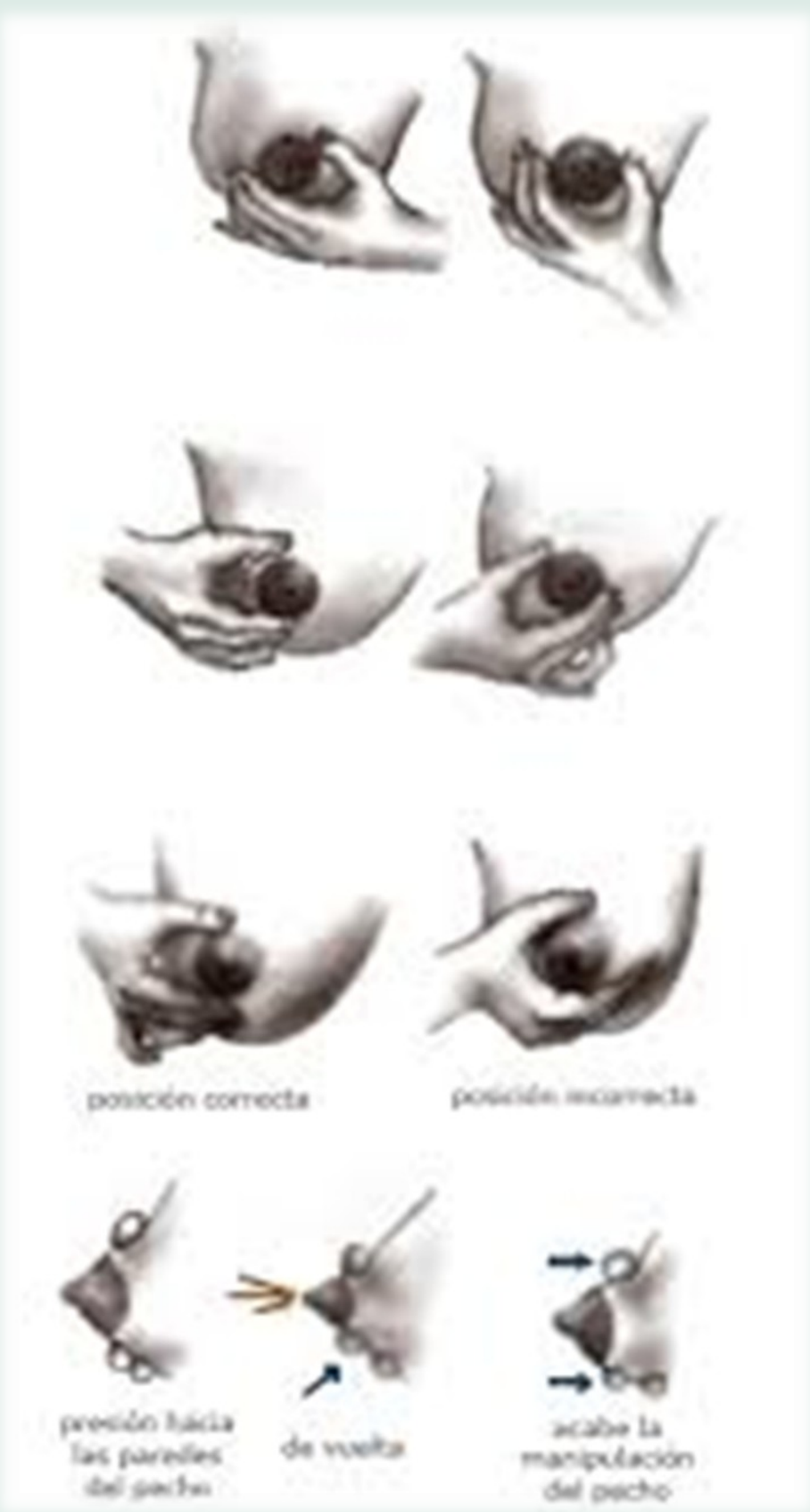
posición correcta posición incorrecta