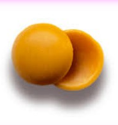
Cazuelitas cera de abeja